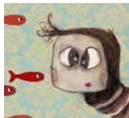
PETITE CHIMÈRE (2016)

Après avoir invité les tout-petits dès 6 mois à voyager dans un décor tout en tissus avec Petite chimère , la compagnie est délicieusement sortie de sa zone de confort avec le spectacle Charlie .