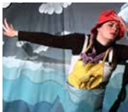
LE BRUIT DES COULEURS (2005)