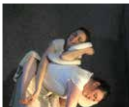
TOUCHE À TOUILLE (2008)