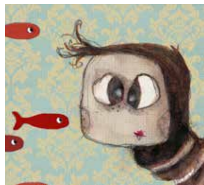
PETITE CHIMÈRE (2016)