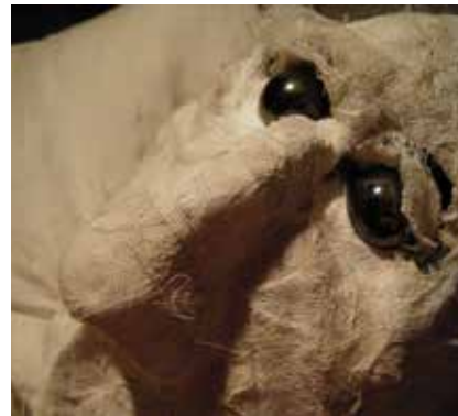
AINSI VA L'AILLEURS (2011)