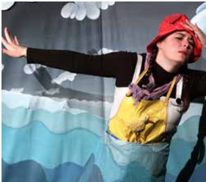
LE BRUIT DES COULEURS (2005)