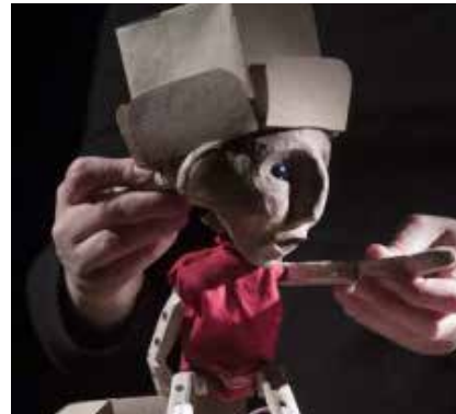
GRANDS PETITS DÉPARTS (2014)