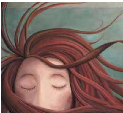
ET LES NUAGES DORMENT SUR MES PAUPIÈRES (2007)