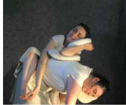
TOUCHE À TOUILLE (2008)

Après avoir invité les tout-petits dès 6 mois à voyager dans un décor tout en fissures avec Petite Chimère (création 2016), la compagnie est délicieusement sortie de sa zone de confort avec cette nouvelle création. C'est certain, la rencontre avec nos spectateurs est déjà intense et pleine d'émotions. C'est certain, nous avons tellement envie de partager cette belle aventure !