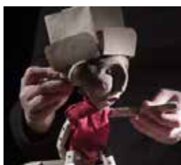
GRANDS PETITS DÉPARTS (2014)