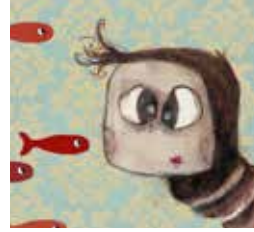
PETITE CHIMÈRE (2016)