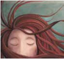
ET LES NUAGES DORMENT SUR MES PAUPIÈRES (2007)