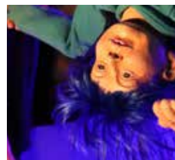
MALICE, DE RETOUR DU PAYS DES MERVEILLES (2024)