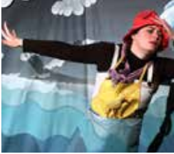
LE BRUIT DES COULEURS (2005)

Les voyageurs immobiles proposent à tous un voyage pour l'imaginaire. Il suffit d'un brin de fantaisie, d'une goutte de sensibilité et d'un soupçon de curiosité pour entrer dans ces univers biscornus mêlant poésie des images et des sons.